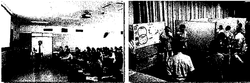
△『キャリア教育科目群』講義の様子

本学共通科目『キャリア教育科目群』は、学生の皆さんの就職活動・キャリア形成をサポートする全学生共通の教育科目です。『キャリア教育科目群』では「働くとは？」をテーマに、キャリア形成の入り口とした『キャリア入門』や企業経営者などをお招き「働く意味」を考える『キャリア・デザインA/B』など、多様な講義を提供しています。