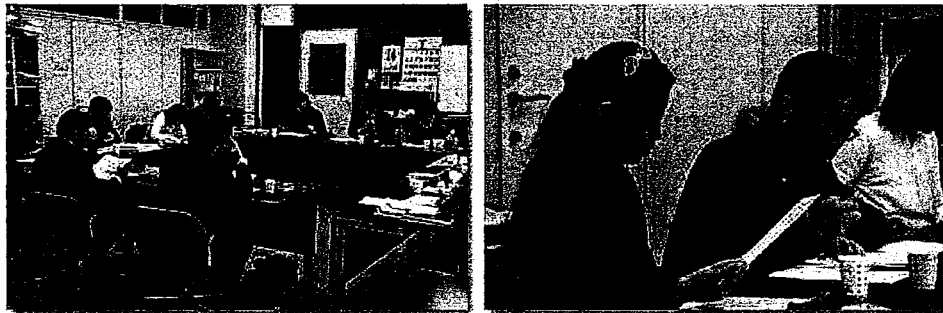
△ミーティングの様子

沖縄国際大学は『キャリア教育科目群』をはじめとした多様な教育・研究を通して、産学または地域との皆さまと協力しながら、地域のこれからの担う人材の育成に取り組んでいきます。