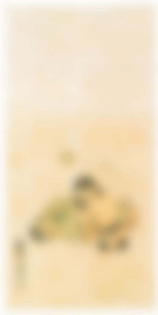
雪村 《蔬果図》 室町時代(16世紀) 紙本墨画淡彩 72.5×36.6 cm. 福島県立博物館