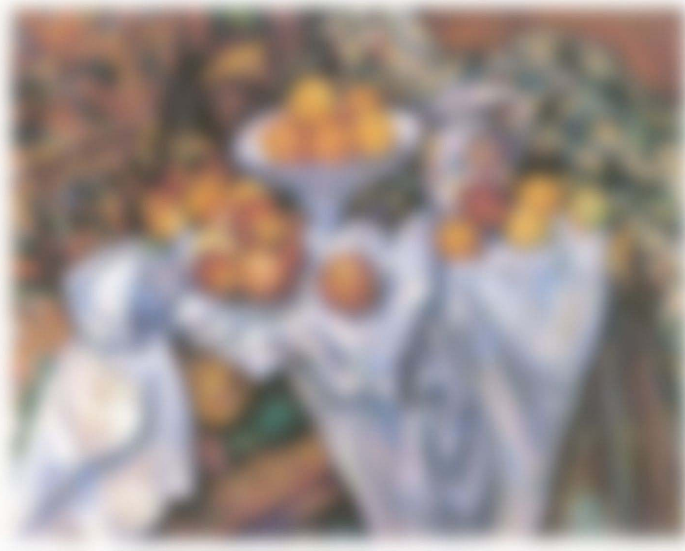
Paul Cézanne, Nature morte aux pommes et aux oranges , 1899, huile sur toile, 74×93 cm. Musée d'Orsay