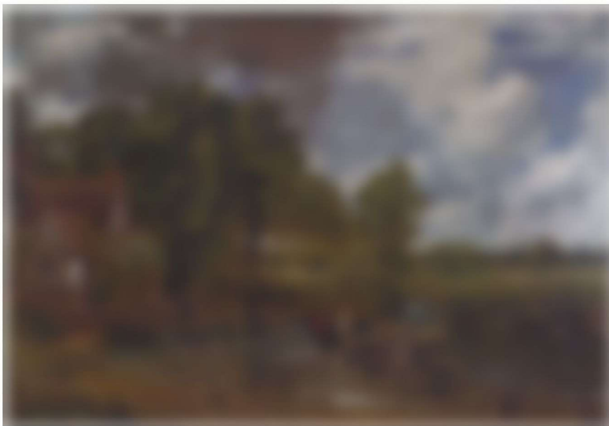
John Constable, The Hay Wain, 1821, oil on canvas, 130.2x185.4 cm, National Gallery, London