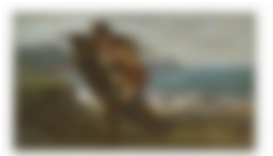
Elihu Vedder, Fisherman and Mermaid , 1888-1889, oil on canvas, 41.0 x 71.8 cm. Fogg Museum, Harvard Art Museums