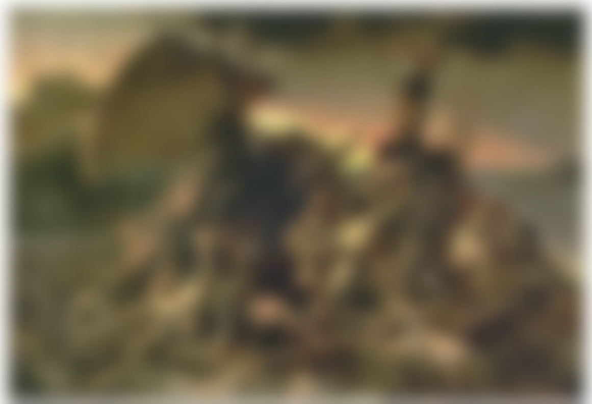
Théodore Géricault, Le Radeau de La Méduse , 1818-19, Huile sur toile, 491.0×716.0cm, Musée du Louvre