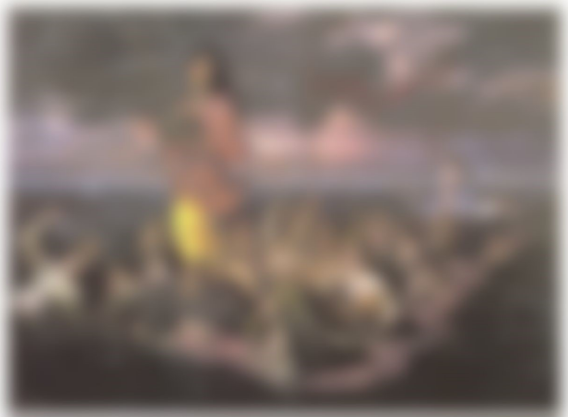
山本芳翠《浦島図》1893-95年頃 油彩・カンヴァス 121.8×167.9 cm 岐阜県美術館