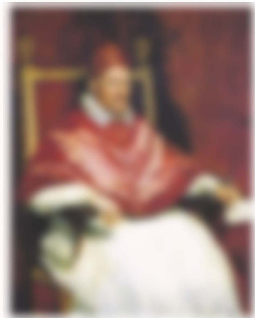
Diego Velázquez Portrait of Pope Innocent X c. 1650 oil on canvas 141x119 cm Palazzo Doria Pamphilj, Rome

https://www.ibiblio.org/wm/paint/auth/bacon/innocent.jpg