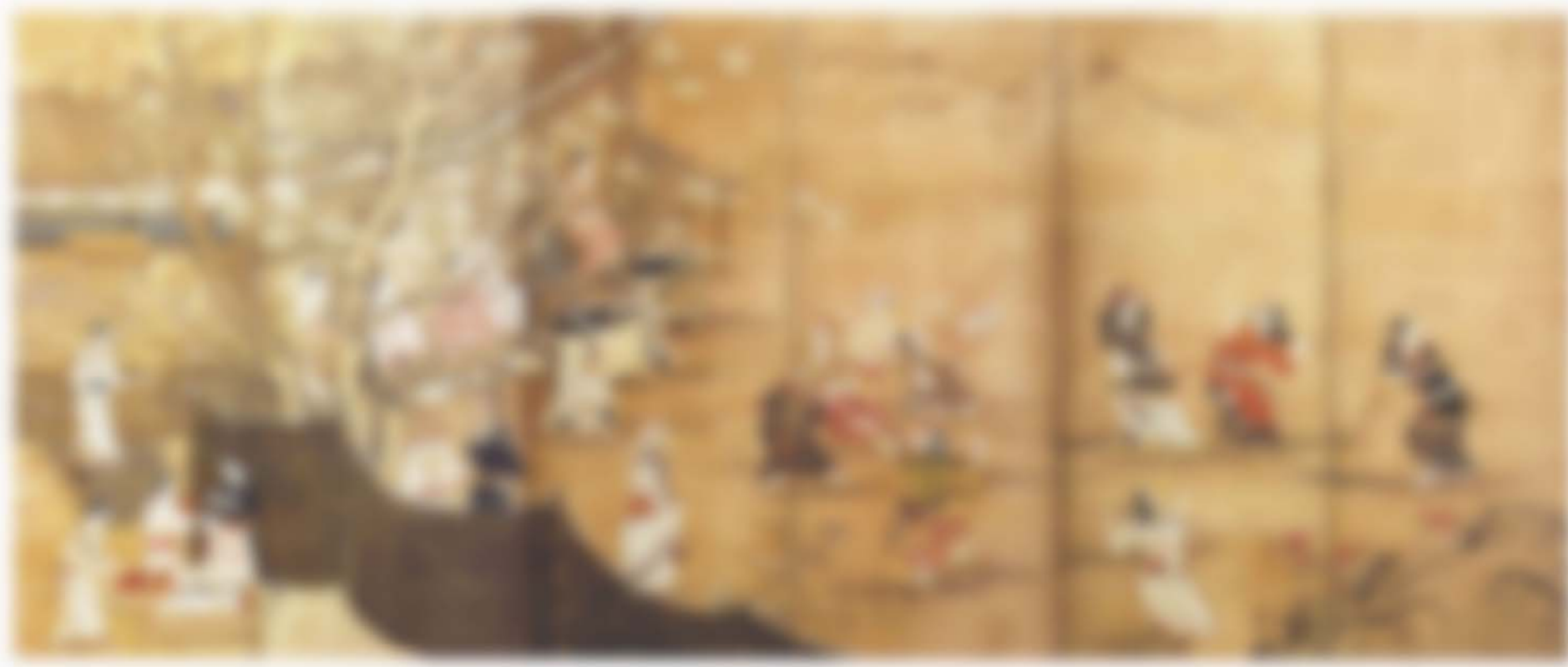
狩野長信 「花下遊楽図屏風」 江戸時代／17世紀