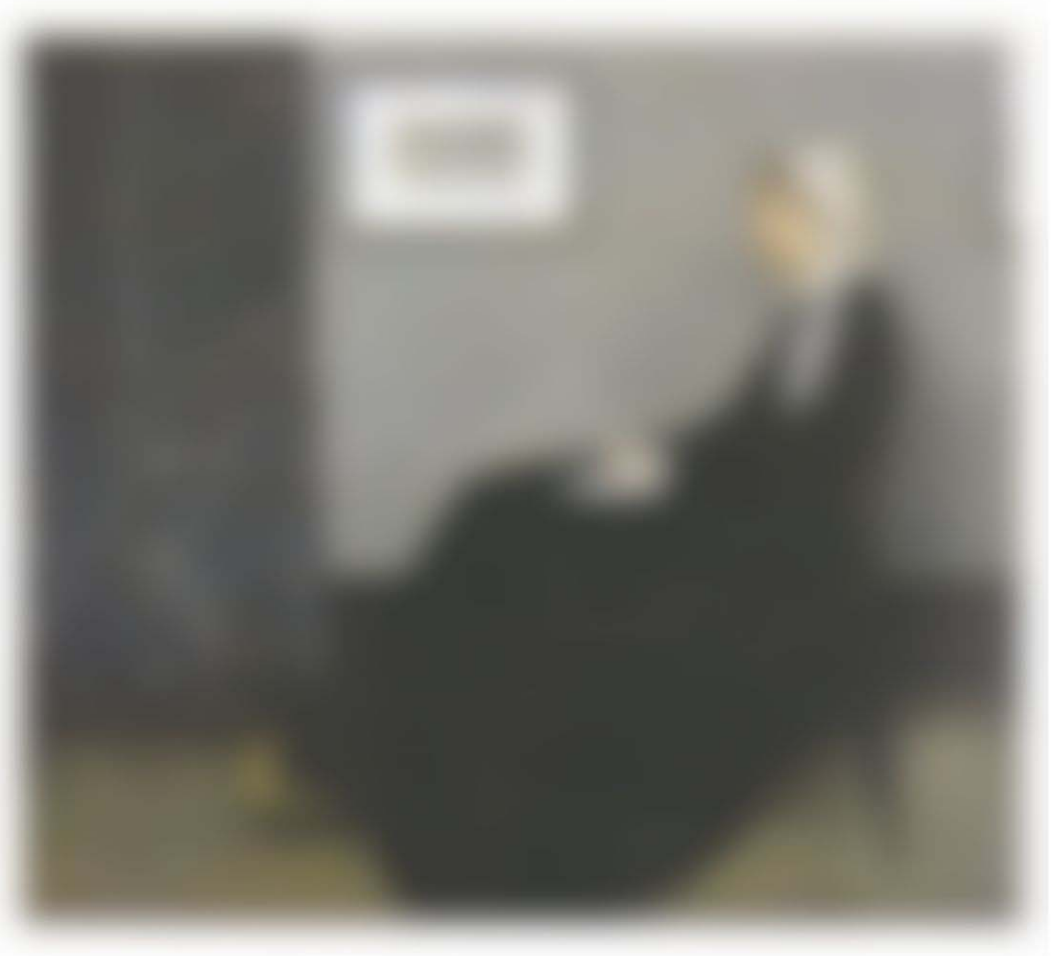
James Abbott McNeill Whistler

http://www.tnm.jp/uploads/fckeditor/blog/201605/uid000224_2016050914414170578495.jpg